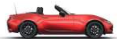
SOUL RED CRYSTAL (46V) 5)