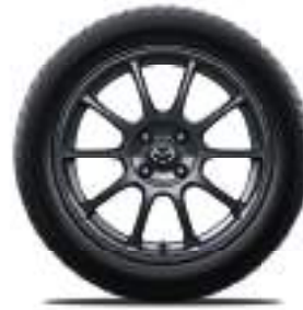
RAYS® 16-Zoll-Leichtmetallfelgen geschmiedet