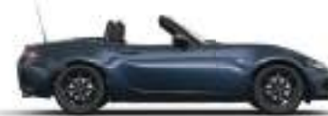
DEEP CRYSTAL BLUE (42M) 4)

1) Sitzmittelbahn in Leganu® Kunstleder. Sitzwangen und Kopfstütze in Stoff. 2) Sitzmittelbahn und -wangen in Leder 3) Sitzmittelbahn in Alcantara®-Stoff. Sitzwangen und Kopfstützen in Leder. 4) Metallic-Lackierung 5) Sonderfarbe