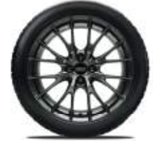
BBS® 17-Zoll-Leichtmetallfelgen geschmiedet