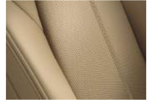
Nappalederausstattung 2) Beige