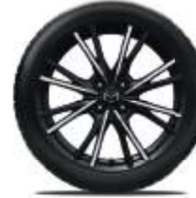
17-Zoll-Leichtmetallfelgen mit Diamantschliff