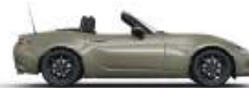
ZIRCON SAND (48T) 4)