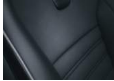
RECARO® Sportsitze 3)