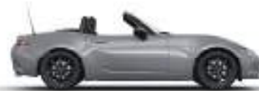
AERO GREY (52C) 4)