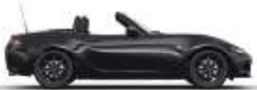
JET BLACK (41W) 4)