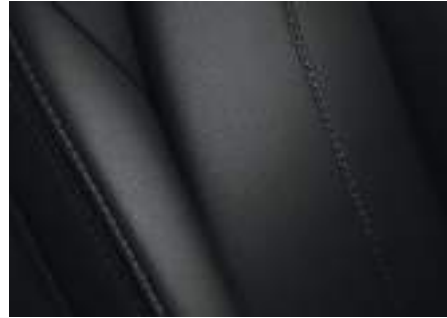
Lederausstattung 2) Schwarz