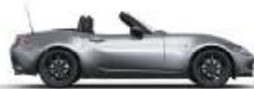
MACHINE GREY (46G) 5)