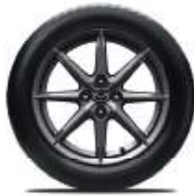
16-Zoll-Leichtmetallfelgen Bright Dark