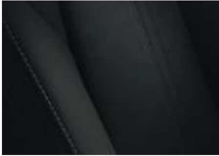
Teil-Kunstlederausstattung 1) Schwarz